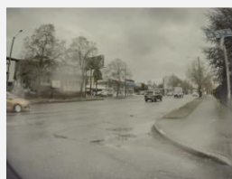
Reconocimiento de voz