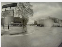
Verificación de las líneas de carril