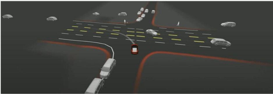
Visualización del entrenamiento de redes neuronales