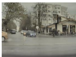
Protección para peatones